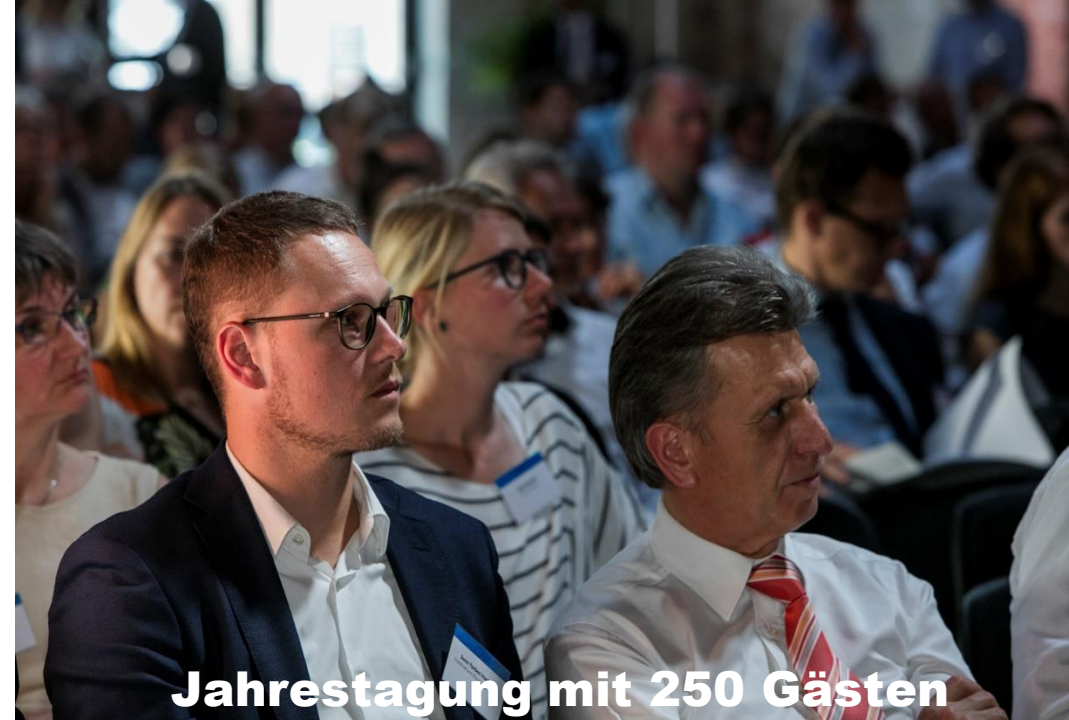
Jahrestagung mit 250 Gästen